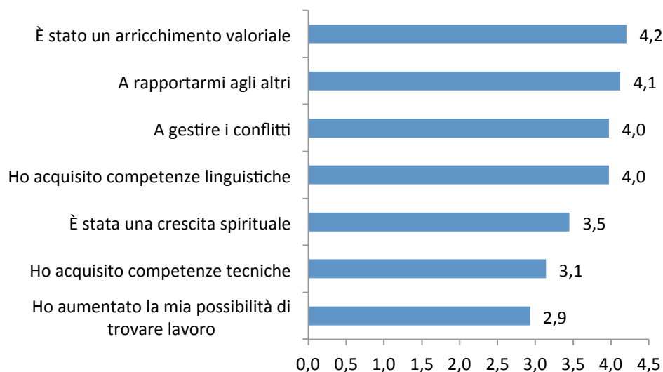
Fig. 2 - Cosa ha imparato (media)

Si conferma ancora una volta come ad essere messi in gioco siano gli elementi costitutivi della persona e sono proprio queste competenze "umane" che, come vedremo, daranno quella marcia in più ai giovani, una volta rientrati